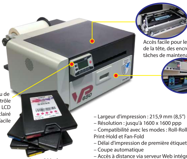
Tableau de Contrôle avec écran LCD rétro-éclairé à lecture facile

Les ports de connexion sont bien conçus et placés à l'arrière de l'imprimante